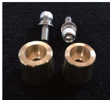
RBP6 RJB809/RJB1409/RJB34UH用ターミナルポスト(D端子) 定価：4,800円(税別)