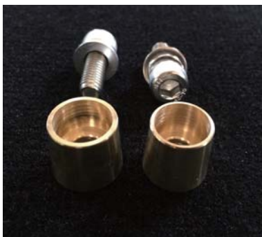
RBP8 RJB2009/RHO3209用ターミナルポスト(D端子) 定価：4,800円(税別)